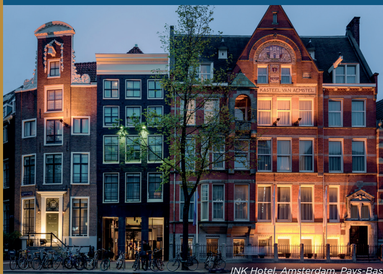
INK Hotel, Amsterdam, Pays-Bas

Les frais annuels de gestion du contrat (et si elle existe, la cotisation pour la garantie plancher) ont un impact sur la valorisation des UC du contrat adossées à Opcimmo