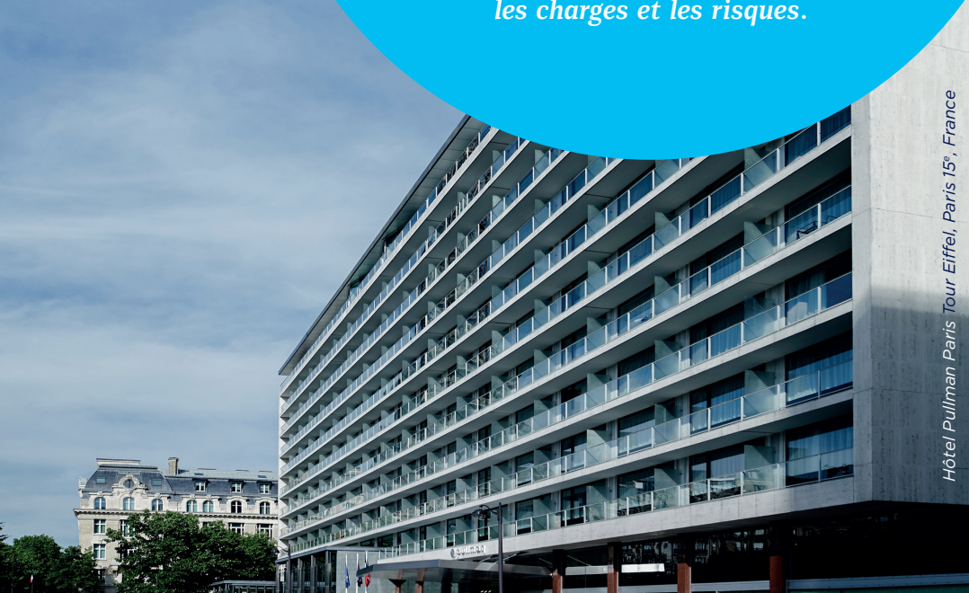
Hôtel Pullman Paris Tour Eiffel, Paris 15 e , France

OPCIMMO applique une approche environnementale et sociale sur ses actifs immobiliers : chaque immeuble est noté sur 100 après avoir été évalué sur la base de différents critères établis en partenariat avec un auditeur externe indépendant (une société indépendante d'ingénierie et de conseil spécialisée dans la performance énergétique et environnementale des bâtiments).